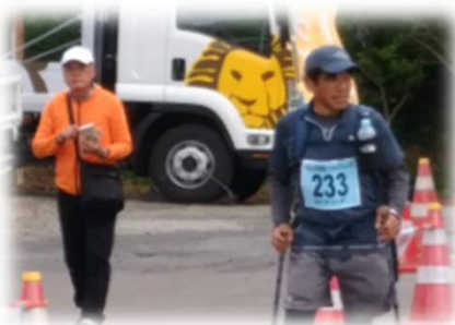
ゴール前での再会