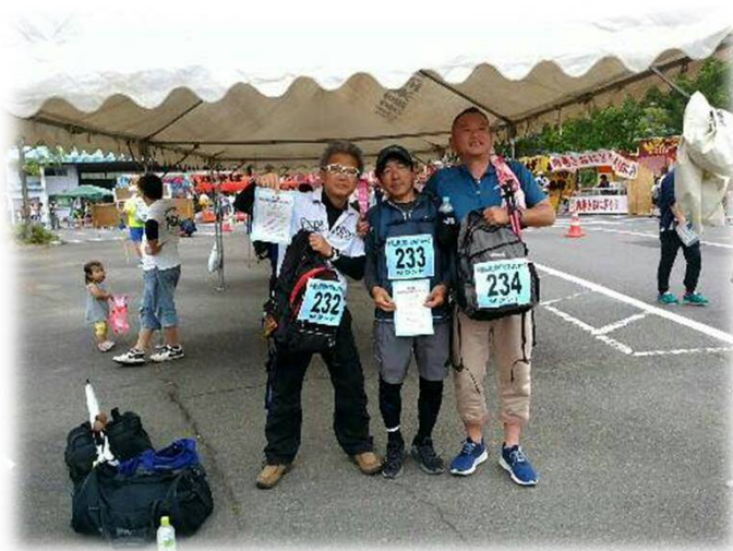
参加者3名の完歩後写真